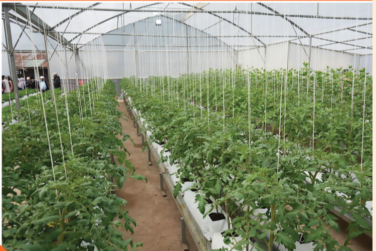
በአዲስ አበባ ከተማ በአርሶ አደሮች ከለው የከተማ ግብርና ስራዎች በጥቁቱ

አርሶ አደር በለጠ በእንስሳት ማድለብ፣ በእጽዋት ልማት እና በመኖሪያዎች ውስጥ በሚሰጥ የመዝናኛ አገልግሎት ዘርፎች ተሰማርተዋል። ከአዲስ አበባ ከተማ አስተዳደር አርሶ አደር እና ከተማ ግብርና ኮሚሽን ያገኛቸው የተለያዩ ድጋፎች ደግሞ ለውጤታማነታቸው መሠረት ሆነዋቸዋል።