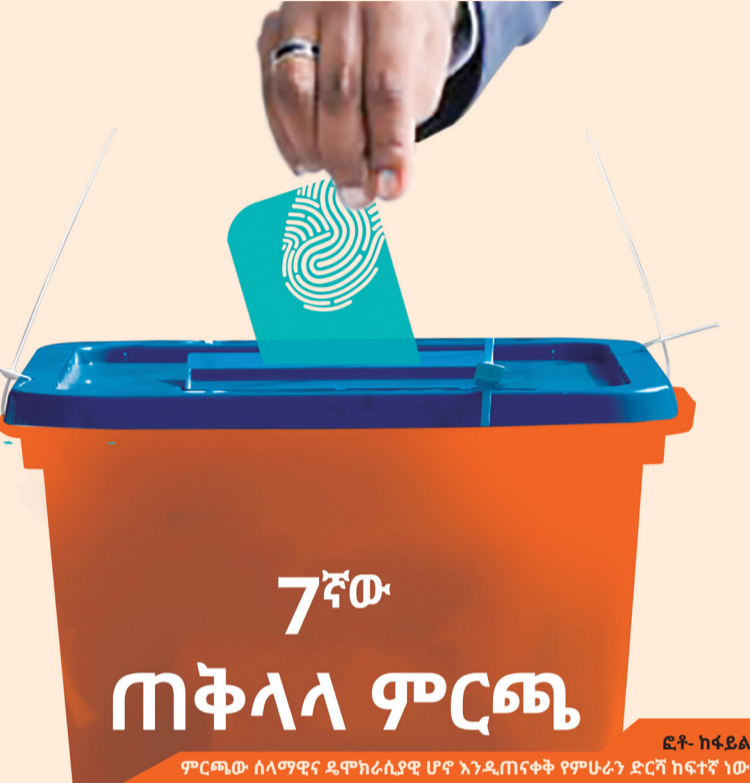
ምርጫው ሰላማዊና ዴሞክራሲያዊ ሆኖ እንዲጠናቀቅ የምሁራን ድርሻ ከፍተኛ ነው

የሚኖረውን ተፅዕኖ በተመለከተ ጥናቶችን በማካሄድና ውጤቶችን በማቅረብ ትልቅ ሚና ይጫወታሉ።