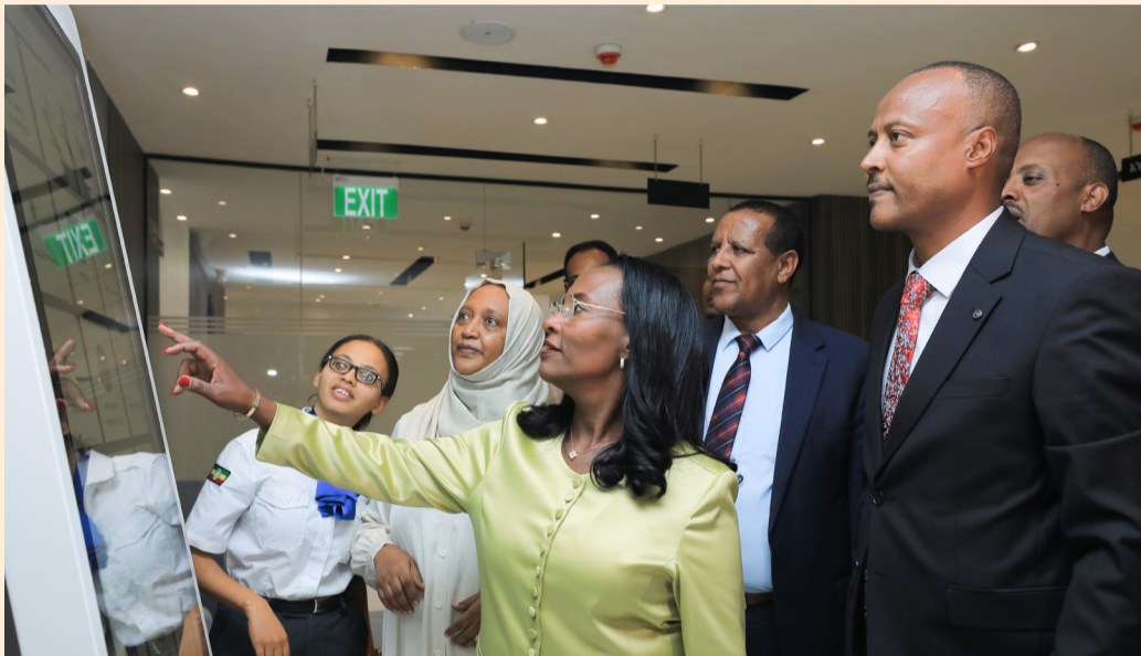
የአዲስ አበባ ከንቲባ ወይዘሮ አዳነች አበቤ 4ኛውን የቂርቆስ ቅርንጫፍ አዲስ መሶብ የአንድ ማዕከል ዲጂታል የመንግስት አገልግሎት ሥራ ሲያስጀምሩ

የአዲስ አበባ ከተማ አስተዳደር የ2018 በጀት ዓመት የአዲስ ዓመት ስጦታ አድርጎ ለአዲስ አበባ ከተማ የአዲስ መሶብ የአንድ ማዕከል ዲጂታል የመንግስት አገልግሎት፣ ተለምዶውን አሠራር በዲጂታላይዜሽን በመተካት፣ ዘመኑን የዋጁ ቴክኖሎጂዎችንና አሠራሮችን በመጠቀም፣ የሥራ ተኮራሪ የሥራ ሥነ ምግባር በሥልጠናና በተግባራዊ እንቅስቃሴ በማሻሻል፣ ምቹ የሥራ ከባቢን በመፍጠር ሕብረተሰቡ በመንግስት አገልግሎት ላይ ያለውን እርካታ ከፍ ለማድረግ እየተንቀሳቀሰ ይገኛል። በዚህም ሰባት ወራትን ባስቆጠረ ዕድሜው ውስጥ በአራዳ ክፍለ ከተማ አስተዳደር የቀድሞ ሕንፃ ላይ በሚገኘው የአዲስ መሶብ የአንድ ማዕከል ዲጂታል የመንግስት አገልግሎት ዋና መሥሪያ ቤት እንዲሁም በቦሌ ቅርንጫፍ አማካኝነት በመቶ ሺዎች ለሚቆጠሩ ተገልጋዮች ቀልጣፋ፣ ዘመናዊ፣ ፈጣን፣ ወጪ ቆጣቢና እርካታን ከፍ የሚያደርጉ አገልግሎቶችን ማቅረብ ተችሏል።