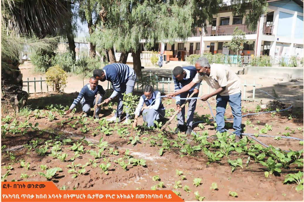
ፎቶ- በገነት ወንድሙ የአካባቢ ጥበቃ ክብብ አባላት በትምህርት ቤታቸው የጓሮ አትክልት በመንከባከብ ላይ

ከትምህርት ቤት ውጭ፤ በቤቱ የውኃ መያዣ ፕላስቲኮችን በመቆራረጥና ግድግዳ ላይ በመስቀል የጓሮ አትክልቶችን (ሰላጣና ቆስጣ...) በማልማት የቤተሰቡን የምግብ ፍጆታ በማሟላት እገዛ በማድረግ ላይ ይገኛል። ከጓሮ አትክልቶች በተጨማሪም የተለያዩ የአባባ ዓይነቶችን ተክሎ እየተንከባከበ እንደሚገኝ ነው