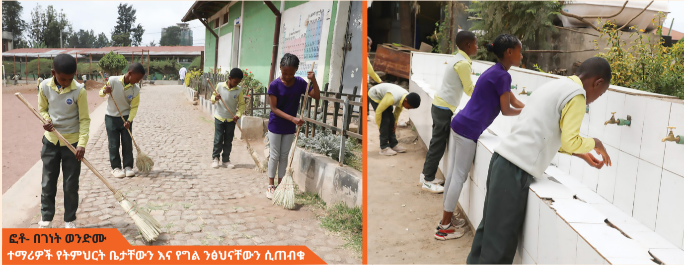
ተማሪዎች የትምህርት ቤታቸውን እና የግል ንፅህናቸውን ሲጠብቁ