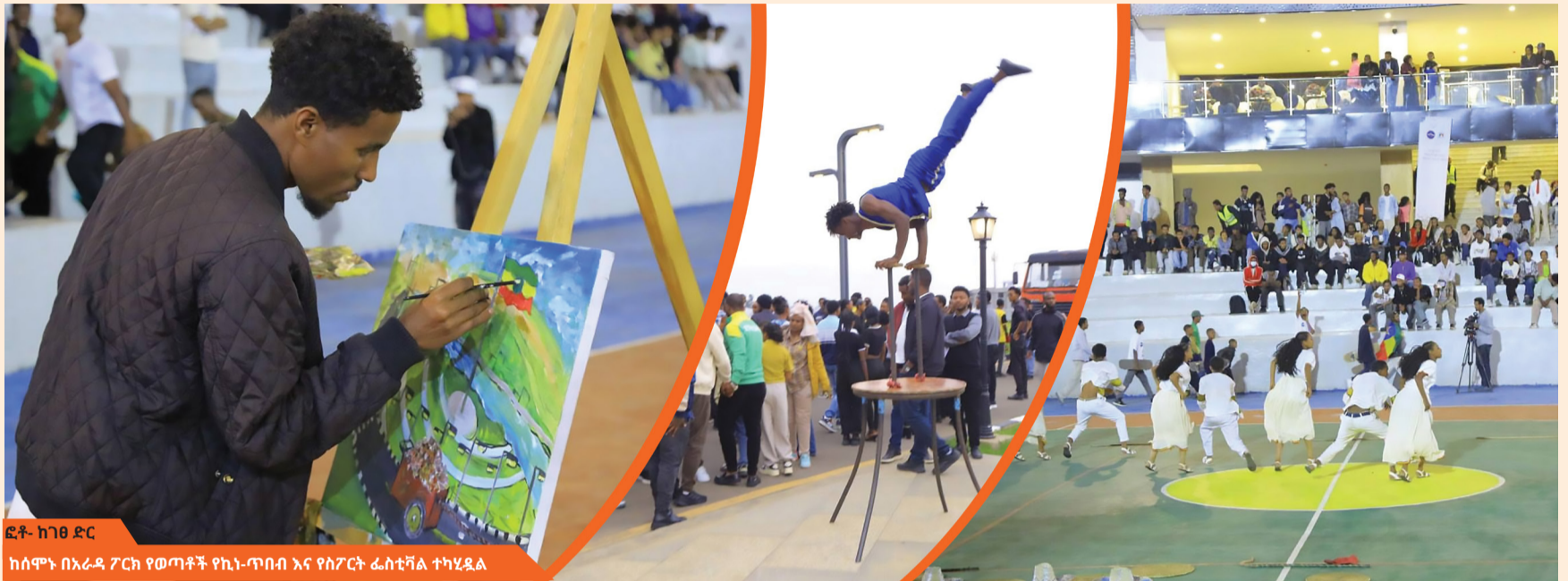
ከሰሞኑ በአራዳ ፖርክ የወጣቶች የኪነ-ጥበብ እና የስፖርት ፌስቲቫል ተካሂዷል