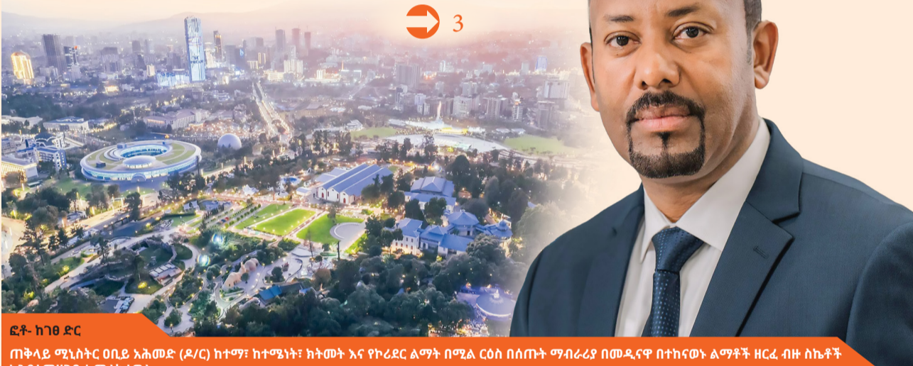
ፎቶ- ከገጠ ድር ጠቅላይ ሚኒስትር ዐቢይ አሕመድ (ዶ/ር) ከተማ፣ ከተማዬ፣ ከትዕይት እና የኮረይራ ልማት በሚል ርዕስ በሰጡት ማብራሪያ በመዲያዎ በተከናወኑ ልማቶች ዘርፈ ብዙ ስኬቶች እንደተመዘገቡ አመለካከተዋል