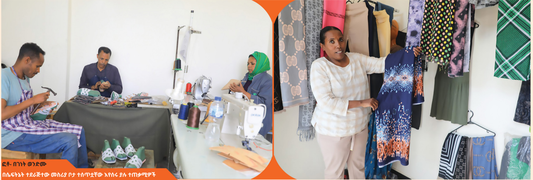
በሴፍቲኒት ተደራጅተው መስሪያ ቦታ ተሰጥቷቸው እየሰሩ ያሉ ተጠቃሚዎች