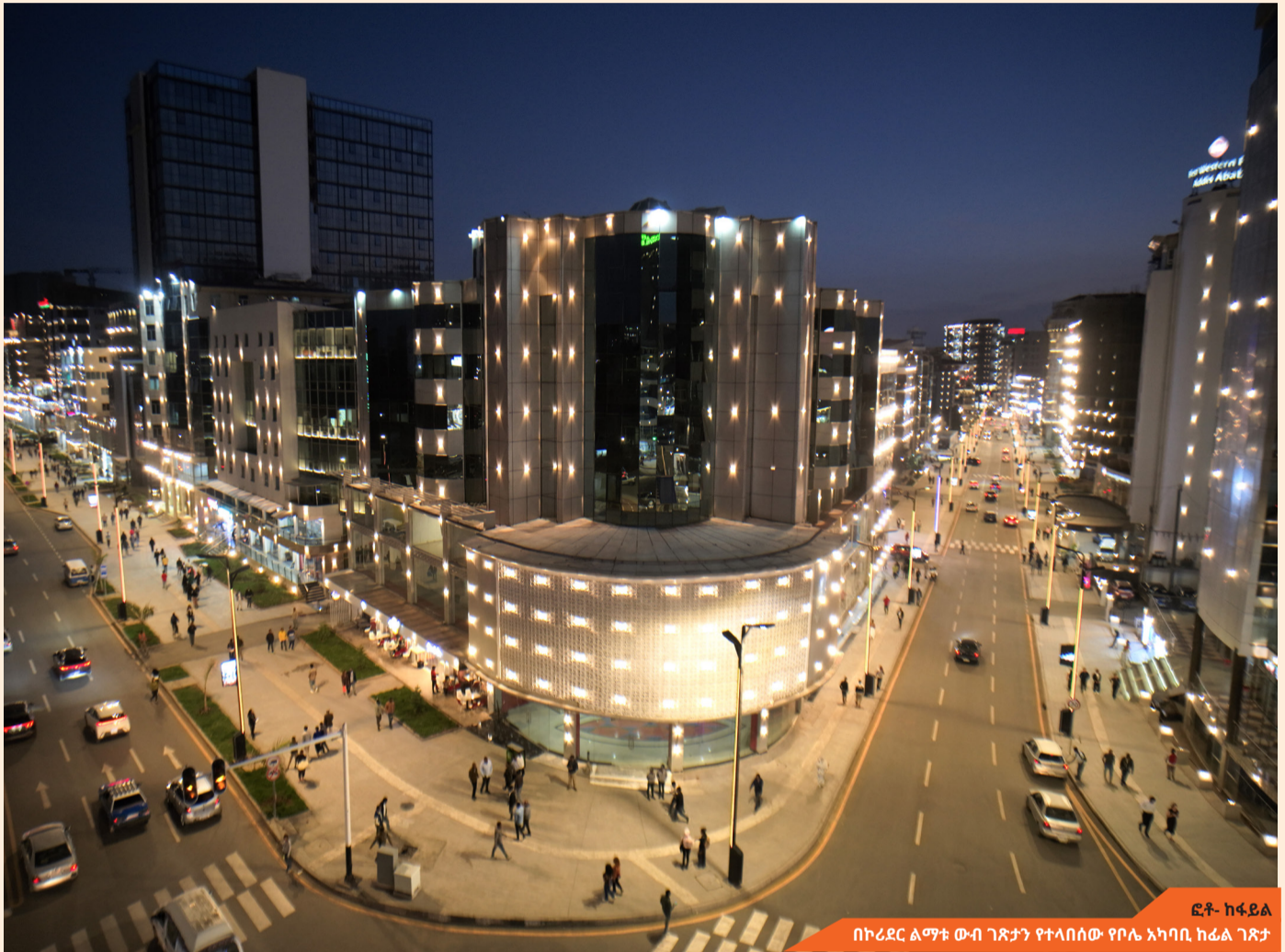
በኮሪደር ልማቱ ውብ ገጽታን የተላበሰው የቦሌ አካባቢ ከፊል ገጽታ