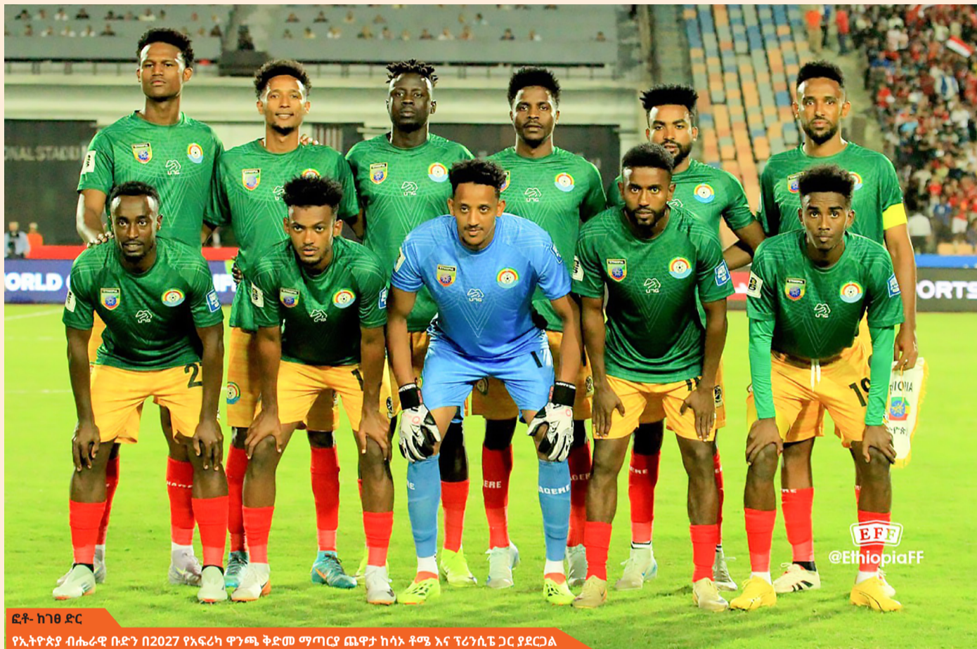
የኢትዮጵያ ብሔራዊ ቡድን በ2027 የአፍሪካ ዋንጫ ቅድመ ማጣሪያ ጨዋታ ከሳኦ ቶሜ እና ፕሪንሲፔ ጋር ያደርጋል

ኢትዮጵያ በ2027 የአፍሪካ ዋንጫ (AFCON) ቅድመ ማጣሪያ ላይ ከሳኦ ቶሜ እና ፕሪንሲፔ ጋር መደልደል ወደ ዋናው የምድብ ማጣሪያ ለማለፍ ወርቃማ ዕድል እንዳላት ማሳያ ተደርጎ ይወሰዳል። ሳኦ ቶሜ እና ፕሪንሲፔ በአፍሪካ እግር ኳስ ውስጥ አዳጊ ከሚባሉ ሀገራት ተርታ ትመደባለች። እስከ ዛሬ ድረስ በአፍሪካ ዋንጫ የመጨረሻው ውድድር ላይ አንድም ጊዜ ተሳትፋ አታውቅም። የካፍ መረጃዎች እንደሚመለከቱት ሳኦ ቶሜ እና ፕሪንሲፔ በፊፋ የደረጃ ሰንጠረዥ 188ኛ ደረጃ ላይ የምትገኝ